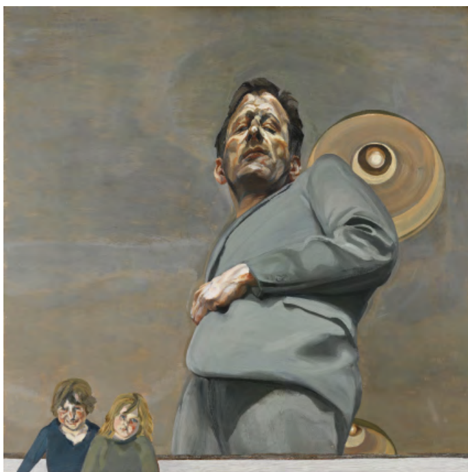
Lucian Freud Reflejo con dos niños (Autorretrato) 1965 Museo Nacional Thyssen-Bornemisza, Madrid

La muestra se divide en varias secciones que, de forma más o menos cronológica, repasan la evolución y la temática del pintor: Llegar a ser Freud , dedicada a sus primeras obras, con una decidida voluntad figurativa frente a las corrientes abstractas dominantes; Primeros retratos , en los que se manifiesta ya su deseo de capturar la esencia de sus modelos; Intimidad , que muestra su predilección por retratar a personajes de su entorno; Poder , retratos de personajes que acepta realizar siempre que acaten sus condiciones de trabajo; El estudio , su espacio de trabajo convertido en protagonista de su obra, y La carne , retratos de desnudos que evidencian una profunda observación del cuerpo humano y de la mortalidad de la carne.