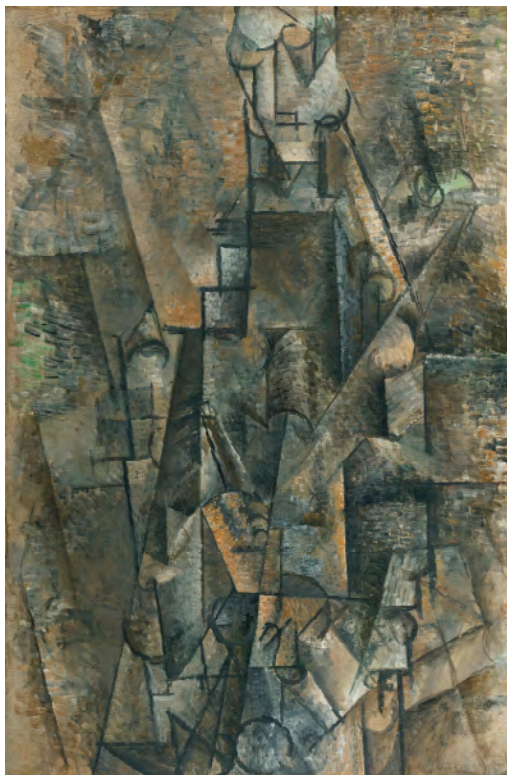
Pablo Picasso Hombre con clarinete 1911 - 1912 Museo Nacional Thyssen-Bornemisza

La exposición incluye una treintena de obras que se presentarán en tres salas de la planta primera del museo. Las obras de Picasso pertenecientes al Museo y varios préstamos del Musée national Picasso Paris y de otros coleccionistas e instituciones dialogarán con pinturas de El Greco, Rubens, Zurbarán, Van der Hamen, Delacroix, una escultura de Pedro de Mena y grabados de Goya. El primer apartado revela cómo Picasso asimila la tradición del retrato y de la imaginería religiosa y la transforma en todo un repertorio de personajes promiscuos y profanos. El segundo nos acerca a los asuntos más íntimos y domésticos con bodegones y maternidades. Y una tercera sala contrasta el tradicional tema de la Pasión con escenas de violencia o de sacrificio, en las crucifixiones, corridas de toros, o en las dramáticas mujeres de los años treinta de Picasso.