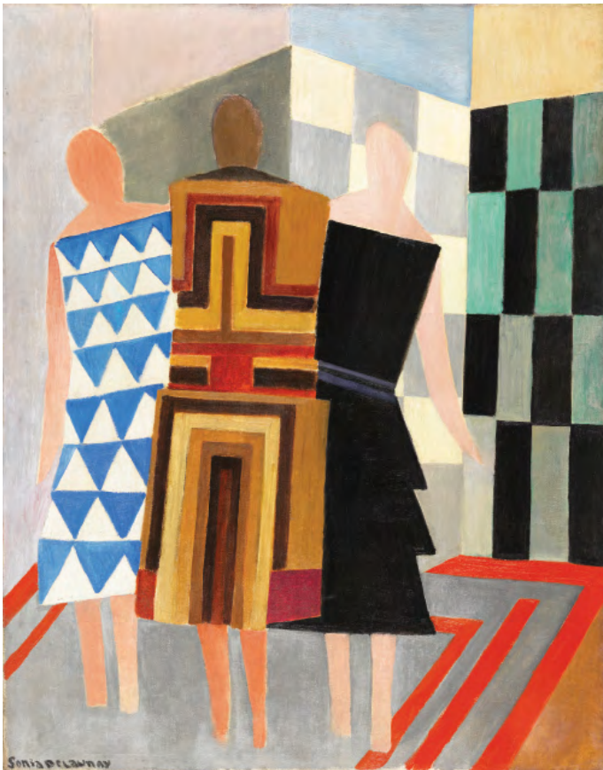
Sonia Delaunay Vestidos simultáneos. (Tres mujeres, formas, colores) 1925 Museo Nacional Thyssen-Bornemisza

El relato muestra cómo las artistas destacaron en los géneros principales de cada época, tomaron posición y aportaron iconografías y miradas alternativas. Reúne casi un centenar de piezas: pinturas, esculturas, obras sobre papel y textiles de artistas célebres en su tiempo, como Lavinia Fontana, Artemisia Gentileschi, Rachel Ruysch, Maria Sibylla Merian, Angelica Kauffman, Élisabeth Vigée-Le Brun, Rosa Bonheur, Mary Cassatt, Berthe Morisot, Paula Modershon-Becker, María Blanchard, Käthe Kollwitz, Natalia Goncharova, Sonia Delaunay, Frida Kahlo y Maruja Mallo, que después fueron relegadas y borradas, al igual que más de medio centenar de artistas hoy menos conocidas, cuya excelencia se muestra en esta exposición.