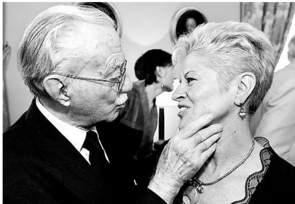
La nueva directora de la Biblioteca Nacional recibe la cariñosa felicitación de su padre

El Plan de Modernización aprobado por el Gobierno daba tres meses para cambiar el Estatuto del museo, así que, si todo se cumple, el nuevo director será elegido antes de la reforma del marco legal. Fuentes consultadas por ABC consideran necesario que Cultura haya previsto las necesarias medidas para que el recién llegado tenga aseguradas las condiciones económicas que el actual marco no permite.