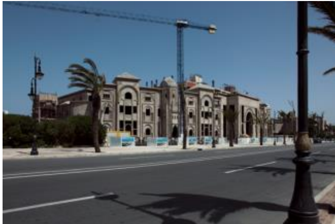
Palais des Arts et de la Culture nue, 2017 (Palacio de las artes y de la cultura desnudo) Fotografía color

miedo y sus complejidades a los dos lados del Estrecho (...) Dos realidades diversas y divididas no solo por un mar sino por vallas fronterizas y límites en ambos lados” 3 .