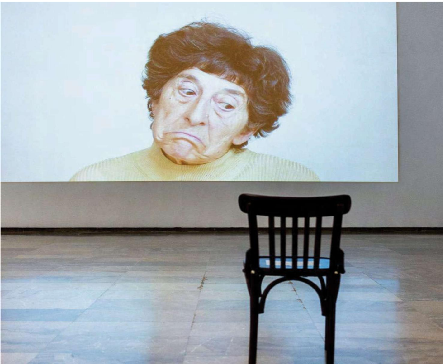
Imagen: Exposición Esther Ferrer comisariada por Margarita Aizpuru en el Centro del Carmen (Valencia)

Es por tanto un curso teórico-práctico, acompañado de material audiovisual abundante y variado, sobre exposiciones, actividades artísticas y de los distintos contenidos integrados en las sesiones del programa, complementados con visitas a algunos espacios expositivos de la ciudad. Enviándose al alumnado modelos diversos en torno a distintas cuestiones del programa.